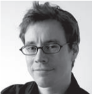
Design Fabian Zimmerli

Všetky práva na akékoľvek technické úpravy vyhradené.