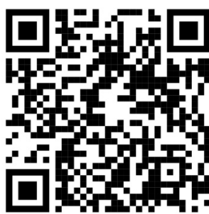
QR kódy pre video návod